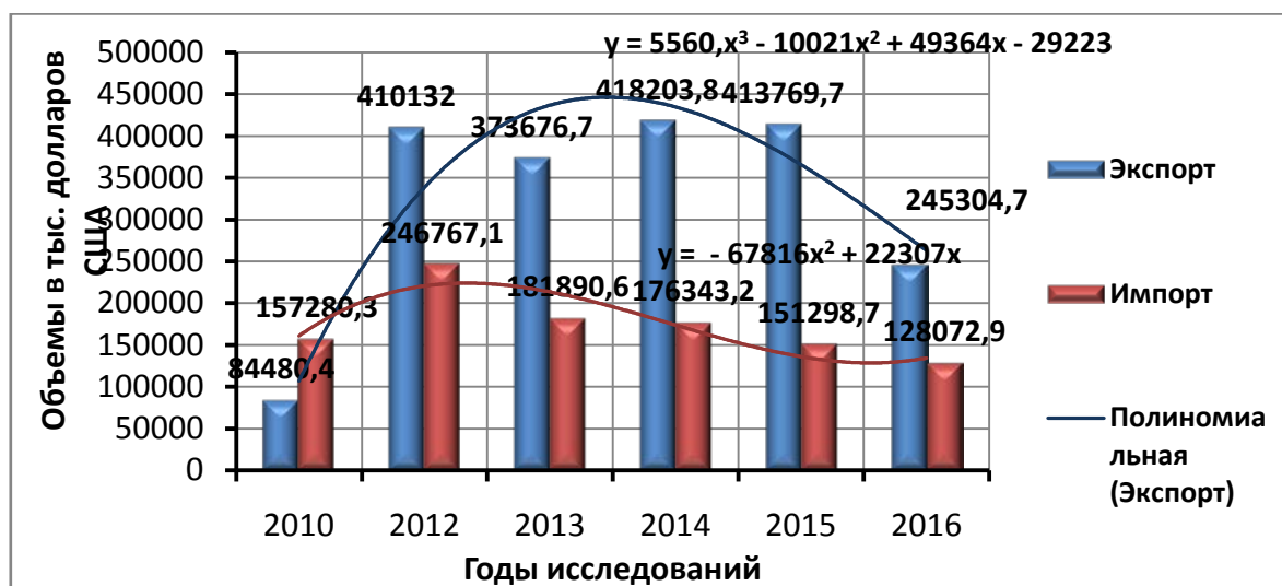
Рисунок 2 - Структура экспорта и импорта продовольственных товаров и сельскохозяйственного сырья Воронежской области

Неподходящий рацион и практика питания в сочетании с недостаточной физической активностью способствуют распространению в области случаев заболеваний сердечнососудистой системы и органов кровообращения, а также диабета, избыточного веса, ожирения, и др. [9].